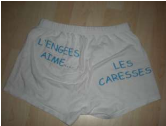
Caleçon ENGEES H/F Tailles disponibles : S, M, L, XL