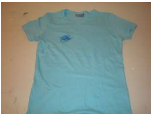
Tee-shirt « Eau + Env. Femme »