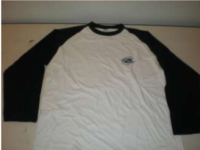
Tee-shirt « Baseball » ENGEES