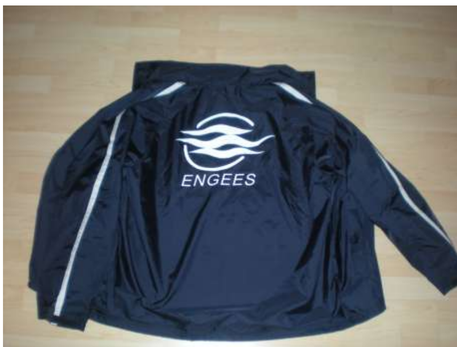
Le k-way :