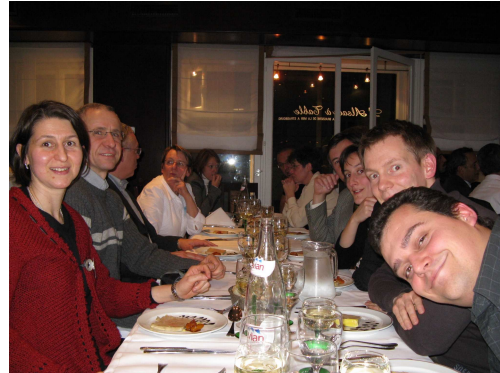
Dîner de gala des 50 ans de l'ENGEES

La vie de l'amicale, c'est bien entendu ce que vous en ferez ! En 2010 il y aura notamment la rencontre Pollutec en décembre à Lyon, les événements autour des 50 ans de l'Ecole et tous les sujets que vous allez retrouver dans les items ci-dessous, vie de l'école, vie des anciens et vie professionnelle.