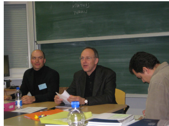
Intervention du directeur de l'ENGEES

L'AMENGEES participe ainsi aux différentes commissions de la vie de l'Ecole ainsi qu'à son Conseil d'Administration . Plus le nombre d'adhérents est nombreux, plus nous pesons bien entendu sur les décisions.