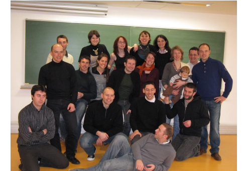
Retrouvailles de la promotion Hautes-Pyrénées

L'AMENGEES tient à jour la base de données des anciens de l'Ecole. Cette base de données est essentiellement constituée d'un annuaire , qui permet notamment l'édition du Guide professionnel, en lien avec l'Association Professionnelle. Depuis l'évolution de l'annuaire sur Internet, les fonctionnalités s'enrichissent : il est ainsi possible désormais de rentrer son parcours professionnel et les différentes formations effectuées après l'ENGEES.